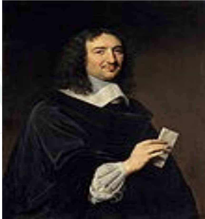
Jean Baptiste Colbert (1619-1683)